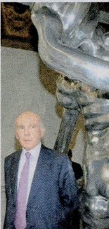
François Pinault ieri in una delle sale della Punta della Dogana. In alto il «Ragazzo con la rana» di Charles Ray. Sopra il titolo a sinistra opera di Piotr Uklanski e a destra di Mike Kelley