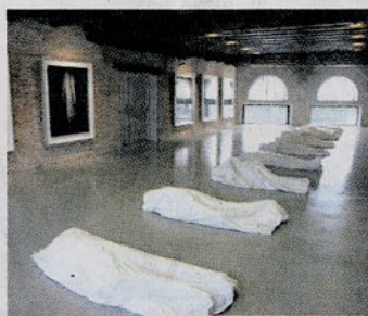
cato il sipario di perline rosso-sangue e bianco-pirola di Felix Gonzales-Torres, velario palpabile tra mondi e situazioni, preparato lo spirito ad assaporare ogni artistico estro, si resta ammaliati dalla panoramica di questo luogo dal gran soffitto a cariatide: propaggine dell'isola di Dorsoduro, non è un neutro

P unta della Dogana inaugura la sua attività con la mostra Mapping the Studio: Artists from the François Pinault Collection , titolo tratto da una videoinstallazione di Bruce Nauman che riflette sull'atelier dell'artista come fucina di energie creative e sullo sguardo del collezionista che, aggirandosi nello studio dell'artista, spinto dalla passione indagatrice, fruga, esamina, scruta e traccia, con il muovere degli occhi, la mappa del luogo. L'esposizione, curata da Alison Gingeras e Francesco Bonami, che si svolge in contemporanea nelle due sedi di Punta della Dogana e di Palazzo Grassi in un unico percorso artistico, presenta trecento pezzi, un dialogo aperto tra lavori di artisti famosi della collezione Pinault (del calibro di Jeff Koons, Cindy Sherman, Richard Prince, Cy Twombly, Robert Gober, Jake e Dinos Chapman) e la produzione di talenti emergenti di generazioni più giovani. Pochi gli italiani: Fontana, Lo Savio, Stügel e Cattelan.